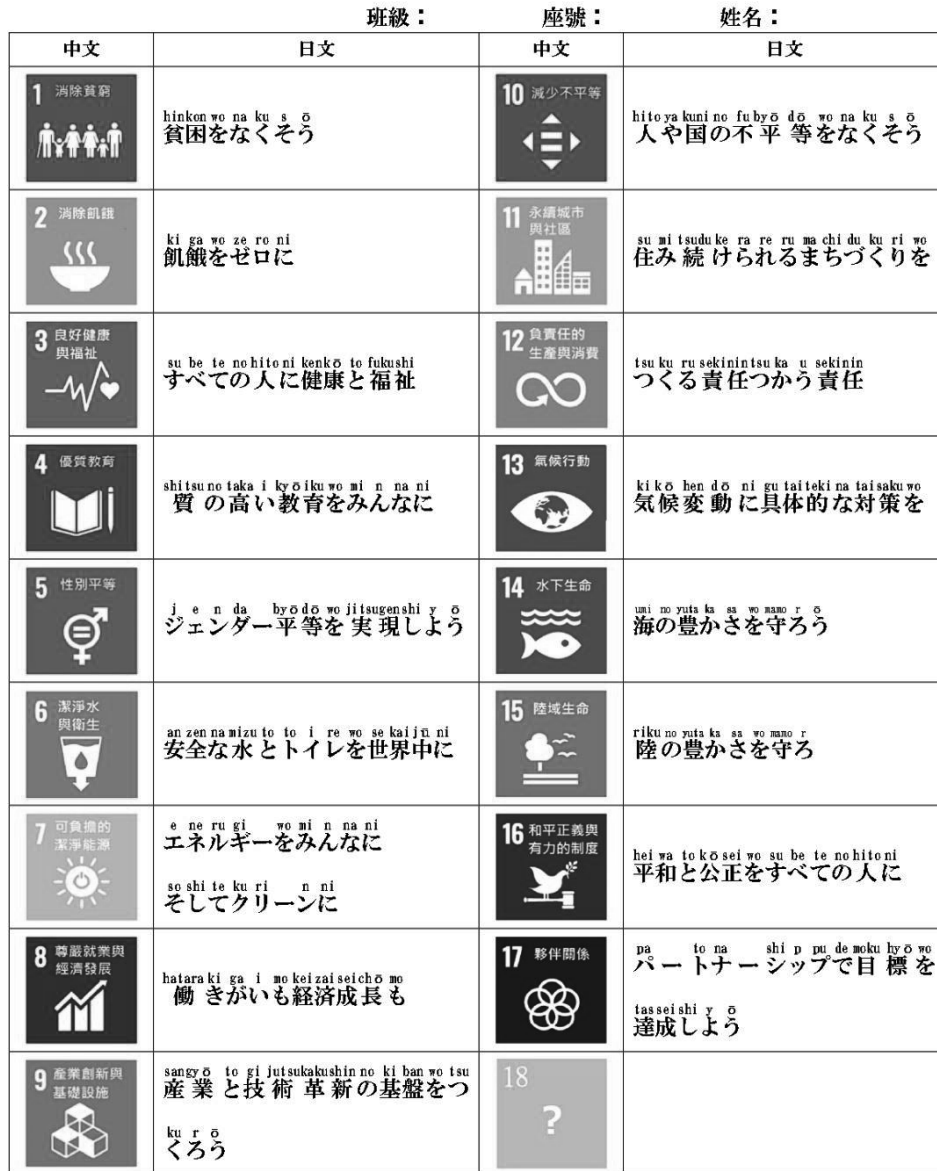
圖 5 SDGs 日文說法(學習單)