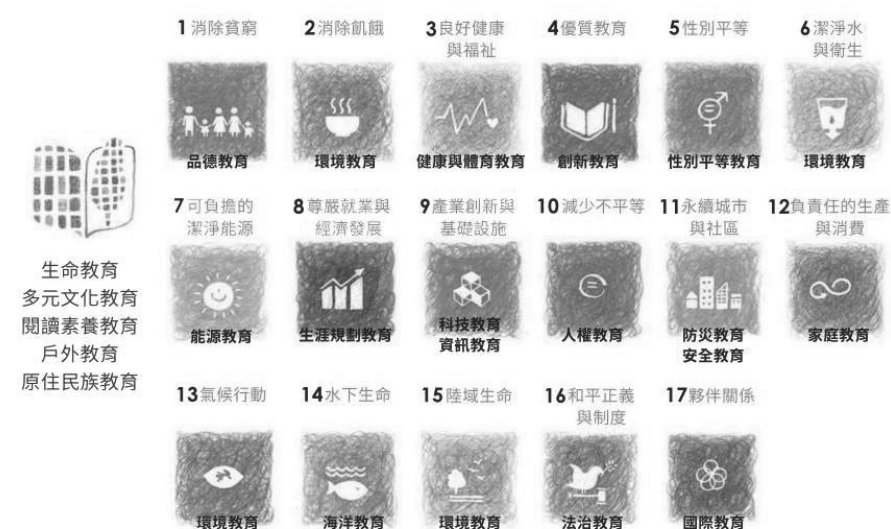
圖 1 SDGs 與 19 議題 4

臺灣雖非聯合國成員，但為了呼應國際潮流及趨勢，致力推動永續發展教育，2020 年 6 月教育部出版《永續發展目標(SDGs)教育手冊 臺灣指南》對接十二年國教 19 項重大教育議題（圖 1），讓 SDGs 回應到課程發展與設計讓學生理解國際永續發展脈絡，並能夠應變未來世代各項課題的素養及技能。因此，同樣在 2020 年 6 月教育部正式啟動《中小學國際教育白皮書 2.0》接軌國際反思臺灣，提出「培育全球公民」、「促進教育國際化」及「拓展全球交流」三大目標，將「注入全球競爭人才的培育元素」與「教導學生善盡全球公民責任」並列未來主要二個努力方向。特別是關於後者，明白規定「未來全球公民必須具備全球永續發展的概念，國際教育應將 SDGs 納入學生學習與實踐的內容。」(教育部 2020b:19)