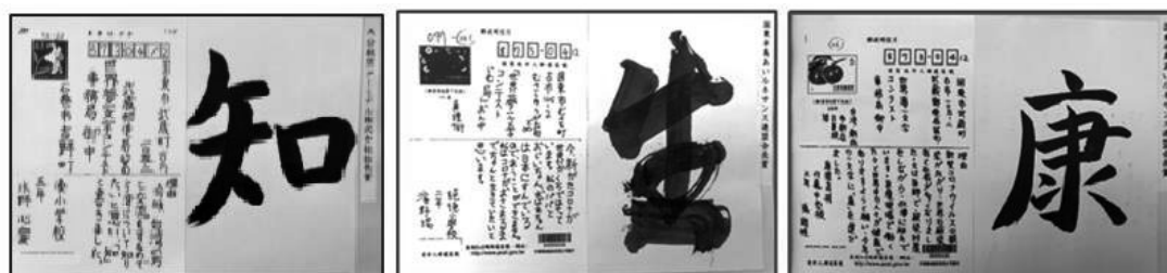
圖 4「世界夢一文字」得獎範例

年的一個字。由以上作品內容可以推知，三人夢想與「SDG4 優質教育」、「SDG17 夥伴關係」以及「SDG3 良好健康與福祉」有所關聯。